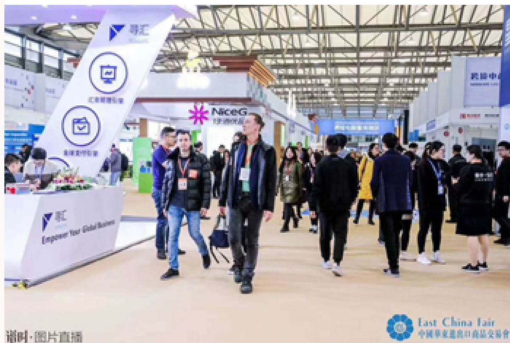
2019年华东进口交易会