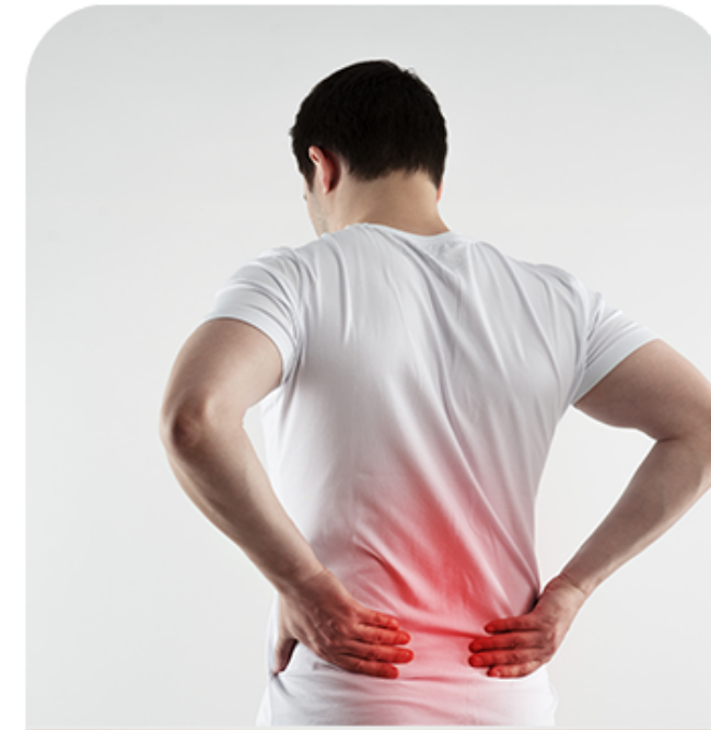
腰膝酸软小便频繁