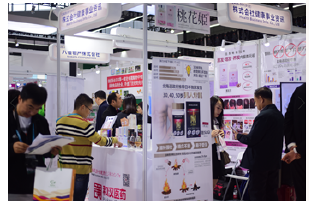
2019年参展中国进口博览会