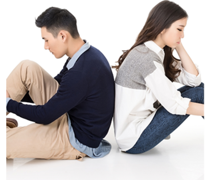
长期备孕迟迟不来