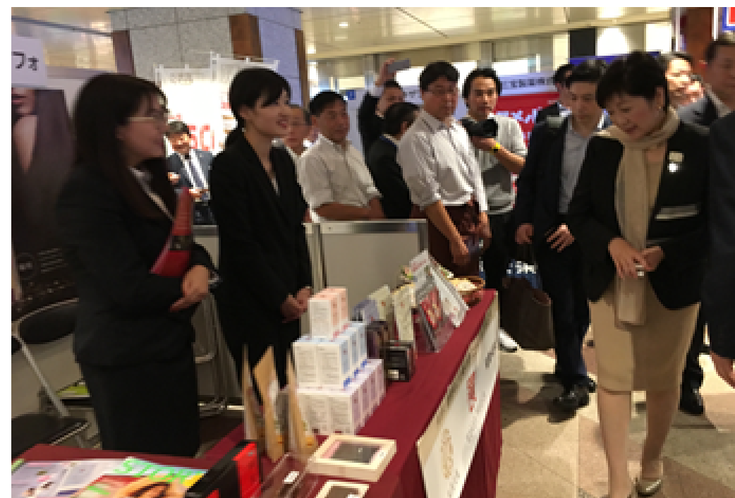
东京otc医药展，东京都知事小池百合子观展。