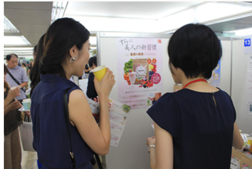
客人试饮诗慕生麴酵素。