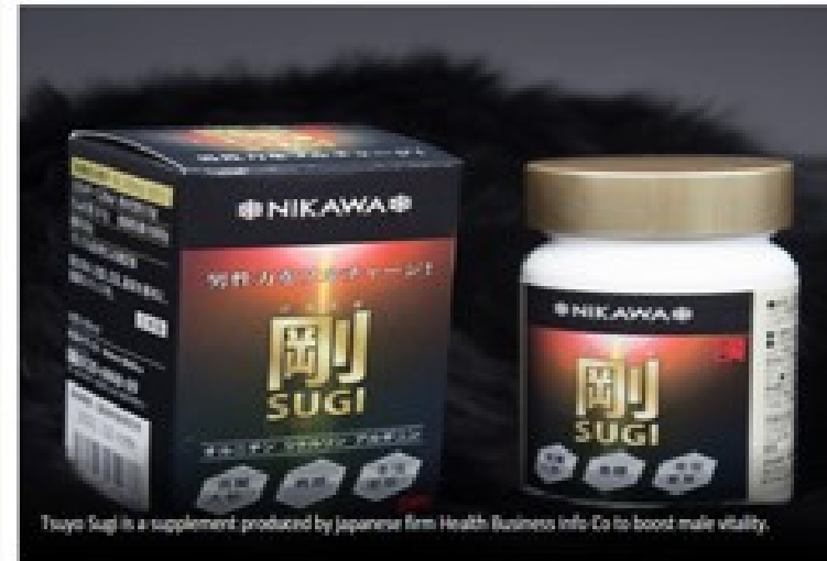
Tsuyo Sugi is a supplement produced by Japanese firm Health Business Info Co to boost male vitality.

Japanese firm Health Business Info Co is using sika deer, which is overabundant in the country, to make supplements for improving male vitality.