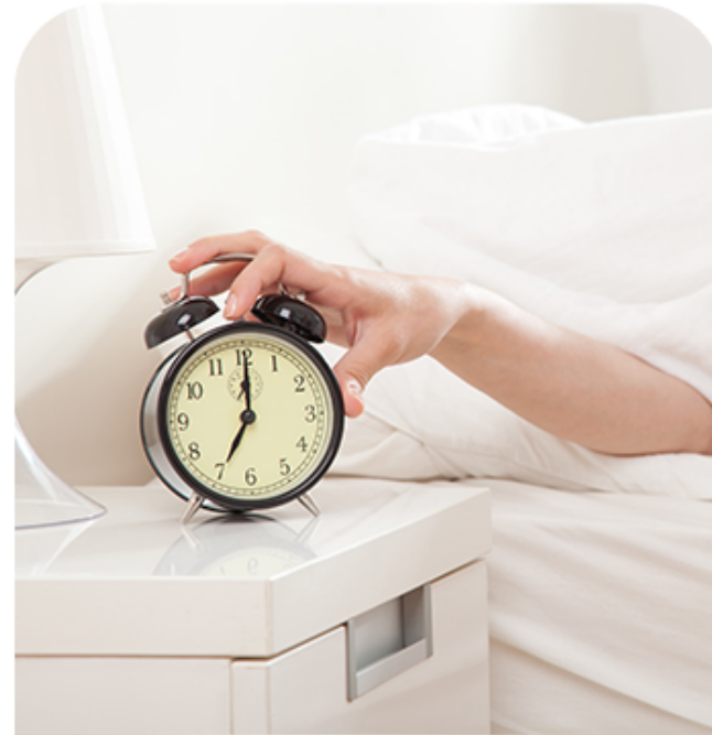
晚上失眠早起赖床