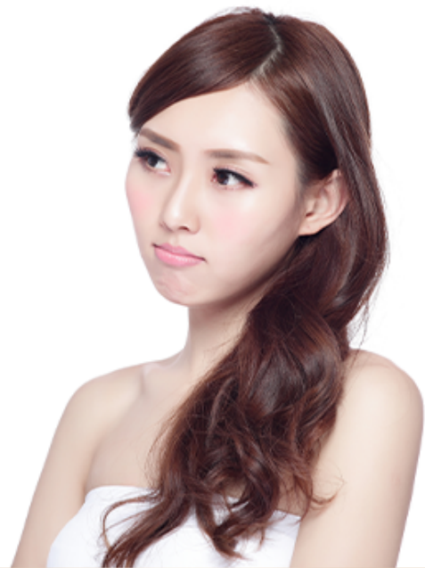
爱人需求无法满足