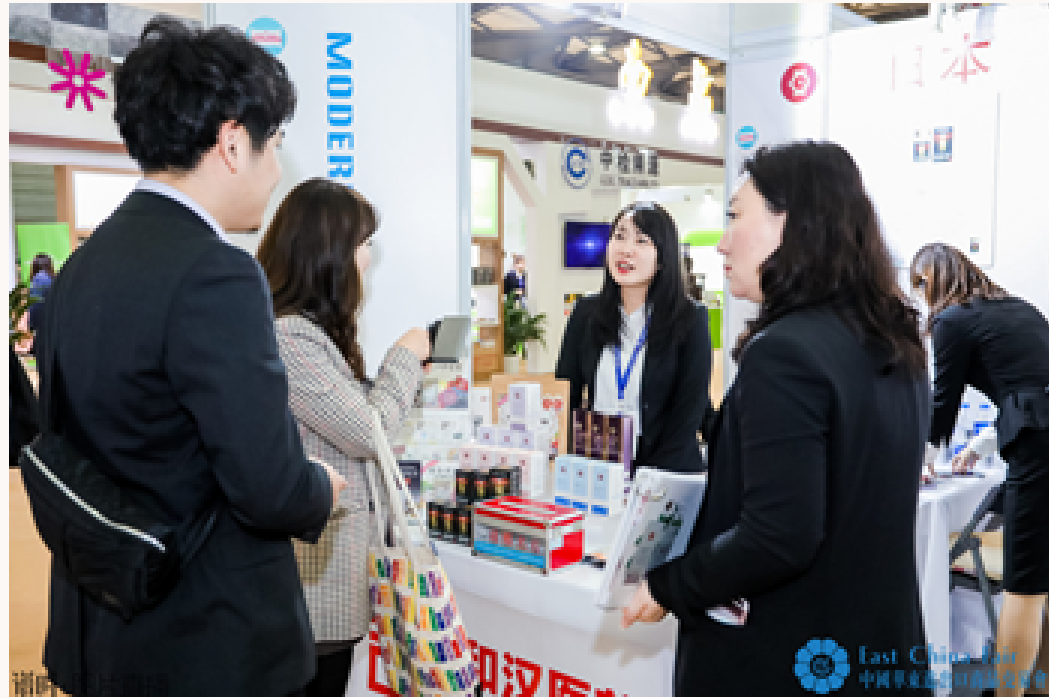
展会上向采购商介绍产品