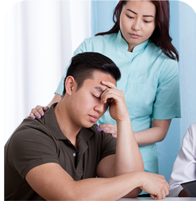
年龄增长精力不济